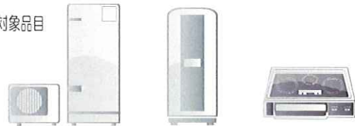
エコキュート 電気温水器 IHクッキングヒーター

※エコキュート+床暖房システムの場合は、エコキュート部のみ保証の対象となります。